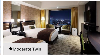
◆ Moderate Twin