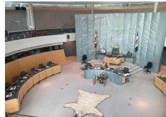
Legislative Assembly 立法議會