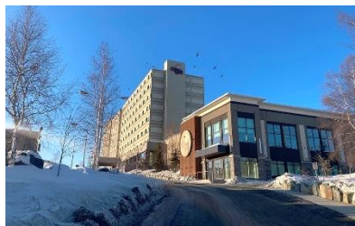
Explorer 建於小山丘之上，所有房間均有景觀