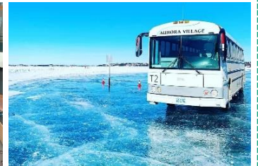
冰上公路 (天氣許可下)