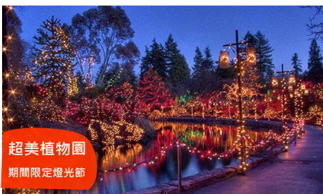
超美植物園 期間限定燈光節