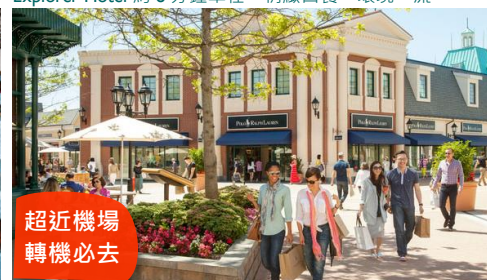
超近機場 轉機必去

展示了栩栩如生的互動裝置，至今仍保留了昔日作為罐頭廠的機器，重現 1930-1950 年期製作三文魚罐頭的工廠，由您可了解由捕魚開始至處理魚獲以及入罐的過程