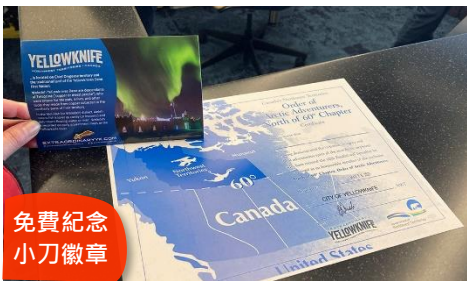
免費紀念小刀徽章