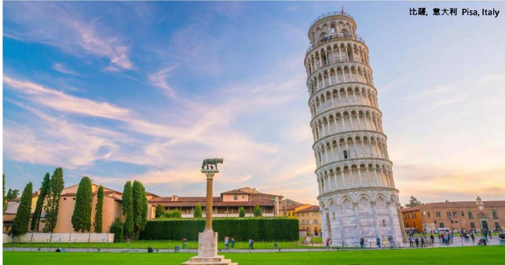
比薩, 意大利 Pisa, Italy