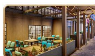
Mike & Sulley's