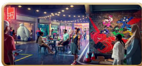
San Fransokyo Street