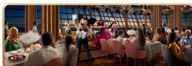
Hollywood Spotlight Club