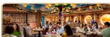
Enchanted Summer Restaurant