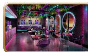
Bewitching Boba & Brews

更多聯絡方法: (852) 6557-4001 | TNT27830881 | TNT27830881