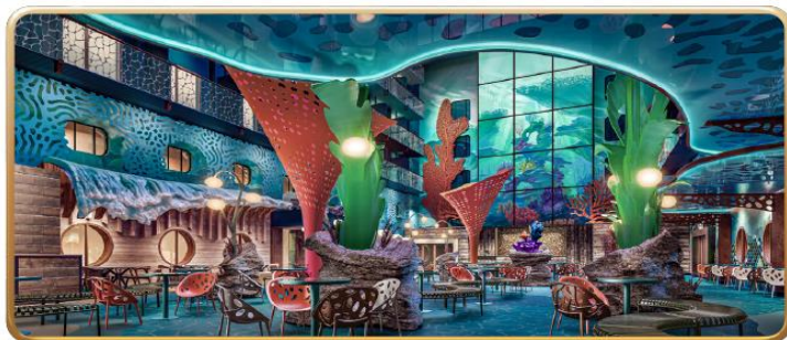
Disney Discovery Reef