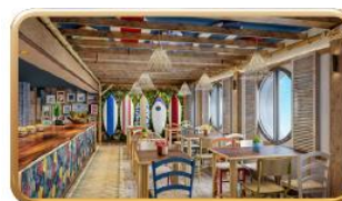
Stitch's 'Ohana Grill