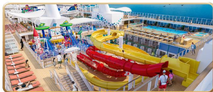
Toy Story Place