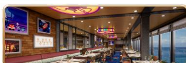
Pixar Market Restaurant