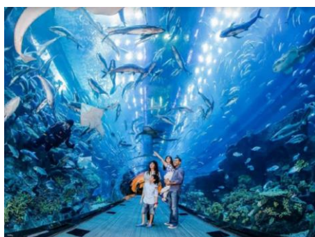
失落的空間水族館