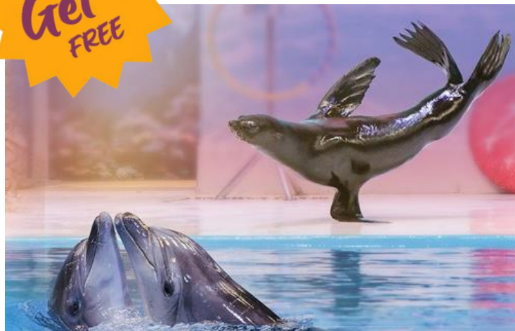
Dubai Dolphinarium – Dolphin & Seal Show Ticket