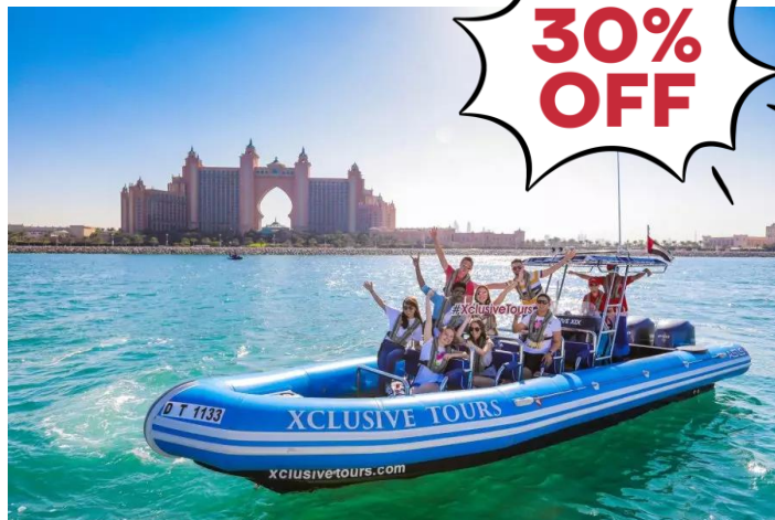
90 Min Guided Sightseeing Tour