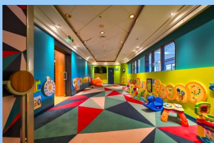
星樂園 (兒童活動中心)