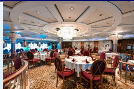
絲路餐廳 (收費中餐廳)