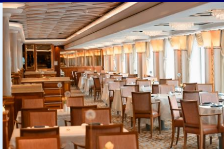
半島餐廳 / 東方餐廳 (主餐廳)