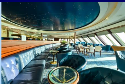
頂點音樂酒廊 (觀景酒廊)