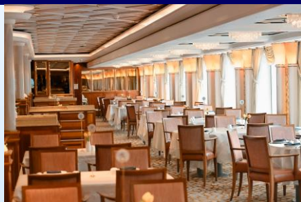
半島餐廳 / 東方餐廳 (主餐廳)