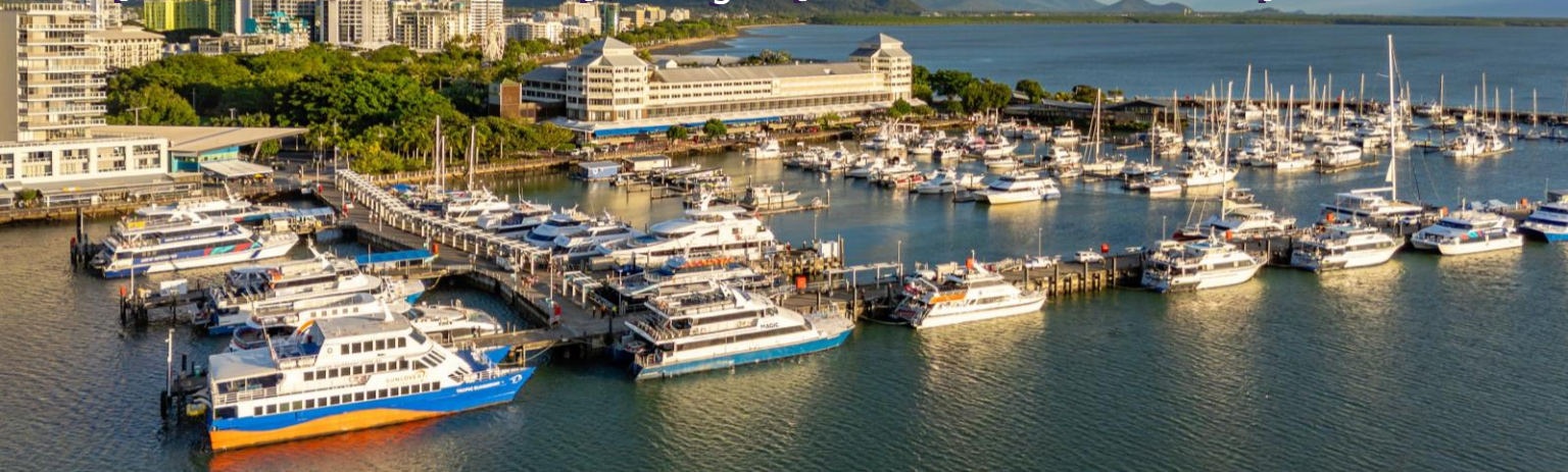
Sunlover Reef Cruises

3夜 [出發日期: 至2026年2月28日] | 3 Nights [Travel Period: Till 28Feb26]